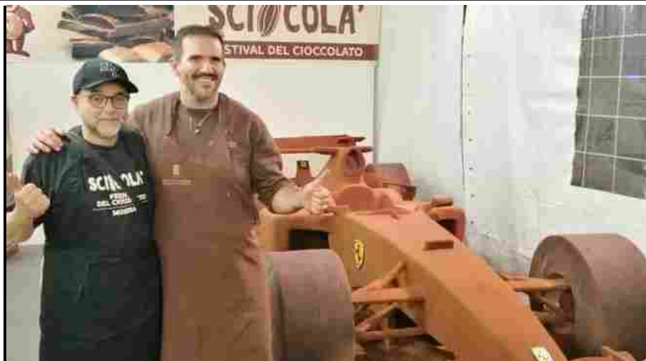
Marrone con la Ferrari di cioccolato

Arezzo, 3 novembre 2019 - Un dolce regalo per un compleanno triste. Il cinquantesimo di un campione indimenticabile. Nasce ad Arezzo la riproduzione in cioccolato, a dimensione naturale, della Ferrari monoposto con cui ha vinto Michael Schumacher. Un uomo diverso dopo il famigerato incidente sugli sci che da qualche anno fa che lo costringe, incosciente, su un letto.