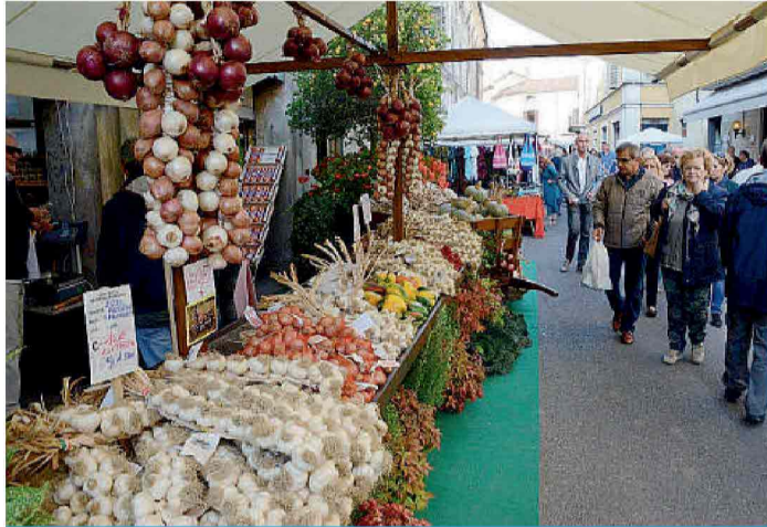
DA OGGI A LUNEDÌ A MONTICELLI LA FIERA DELL'AGLIO

● La 43ª Fiera dell'aglio, organizzata dalla Proloco di Monticelli in collaborazione con il Comune, aprirà gli stand nella giornata di oggi, venerdì, già al mattino con il banco di beneficenza organizzato da Avis, Aido e Caritas. Dalle 19 si potrà gustare la spaghettaglio e olio oppure le bruschette offerte dalla Proloco. La serata sarà allietata dalla musica dell'orchestra da ballo Renzo e i Menestrelli. Domani, sabato, la fiera entrerà nel vivo con il mercatino dei creativi e quello dei sapori e dei prodotti tipici. L'inaugurazione ufficiale sarà alle ore 15 con l'apertura della mostra-mercato dell'aglio e con la partenza del corteo dal castello Pallavicino-Casali con numerosi figuranti in costume d'epoca e con Re Aglio a fare bella mostra di sé. Sbandieratori e tamburi arrivati da Isola Dovarese arricchiranno la giornata. Laboratori per bambini, stand gastronomici, street food internazionale e mostre d'arte si susseguiranno per entrambi i giorni. Alle 20,30 ci sarà un raduno di bande musicali con il gruppo monticellese "Zanella" che, dopo la sfilata, terrà un concerto alle 21 in piazza D'Azeglio. Dalle ore 22,30 si esibiranno i comici di "Colorado café" e "Zelig", Beppe Braida, Max Pieriboni e il Mago Luca Elias. Nella giornata domenicale negozi aperti, bancarelle della fiera e mercatini saranno a disposizione dei visitatori dalle 9 alle 22. Continuerà la mostra nel castello intitolata "Language e Styles" e si potrà