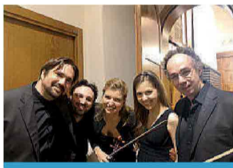
QUINTETTO AL NICOLINI L'11