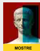
All'Ara Pacis una mostra sull'Imperatore Claudio fino al 27 ottobre 2019 Museo dell'Ara Pacis SCOPRI