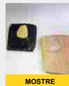
A Roma la mostra "ClaustroMania" fino al 25 ottobre 2019 Giardino di Sant'Alessio all'Aventino SCOPRI